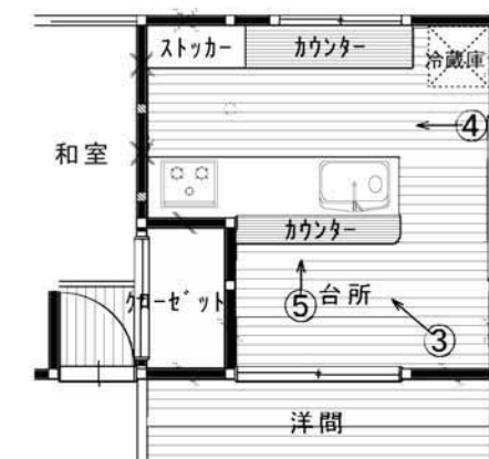
リフォーム後平面図