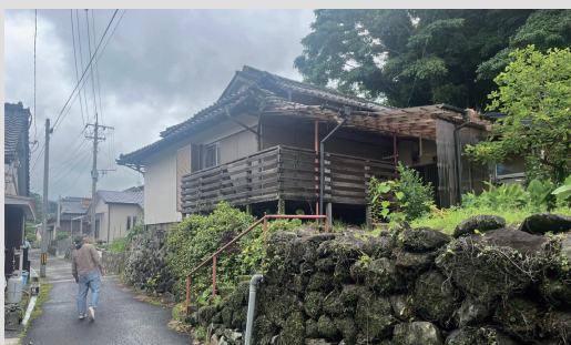
① 既存写真：道路からの見上げた外観