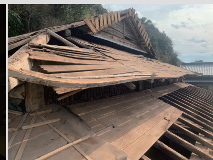
⑤ 現場写真：瓦撤去後の野地板の様子