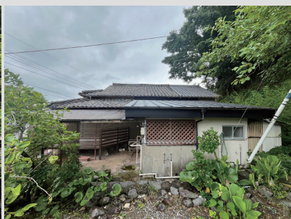
② 既存写真：玄関正面からの外観