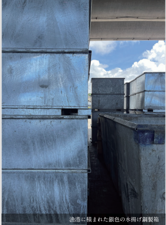
漁港に積まれた銀色の水揚げ銅製箱