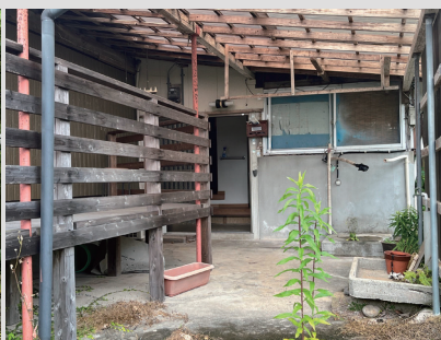
③ 既存写真：玄関と解体した増築部分